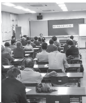
風力発電を考える集い (大在公民館)

環境部長 事業者が調査し、公表した環境影響評価について、環境審議会では、「騒音・低周波音に関して、稼働後は事業者が調査し、周辺住民の聞き取りを行う中で、環境影響が著しい場合は施設の稼働制限を加えること。」などの意見を提出した。