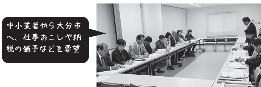
大分民主商工会との申し入れ(11/26)