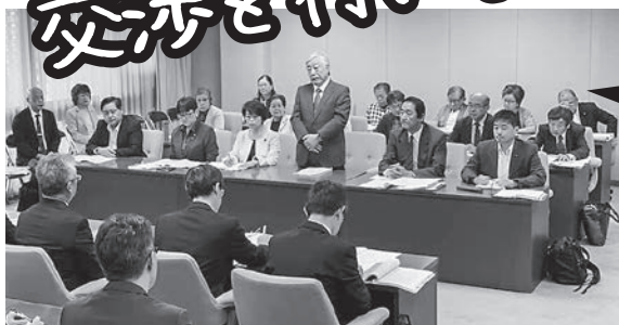
日本共産党大分県委員会の予算要望(10/25)