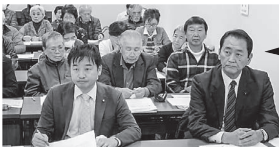
大分県社会保障推進協議会との自治体キャラバン(11/21)