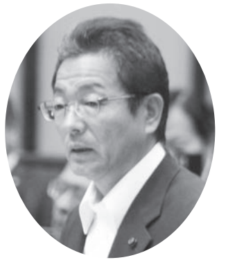
広次 忠彦 議員

当該の工場では、廃プラスチックや建築廃材などを、固形燃料にリサイクルしています。火災発生1日後の夜などに、敷地の住民から「外に出ていると、眼やのどが痛い。だいじょうぶだろうか」「ウォーキングしていて、本当にのどが少し痛くなりましたよ」などの相談や声が寄せられました。廃プラスチックなどが、「野焼き」状態となっており、ダイオキシン類などによる健康などへの影響はないのか見解を求めました。